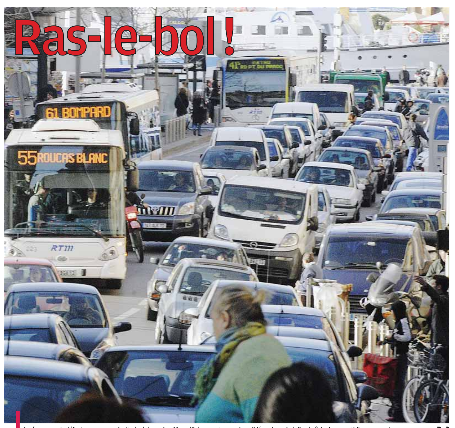
Aménagements défectueux, passe-droits, incivisme. Les Marseillais en ont assez de ce "désordre urbain" qui gâche leur quotidien. P. 3

Un milliard d'euros pour le grand chantier de développement et de remise à neuf du réseau ferré régional à l'horizon 2013. P. 2