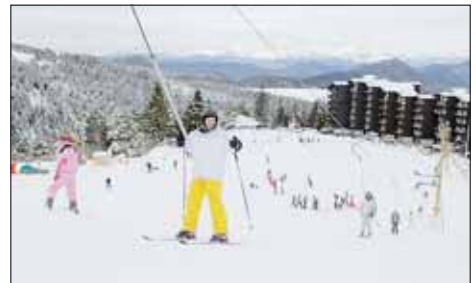
Un environnement protégé pour un séjour en famille. P. 26